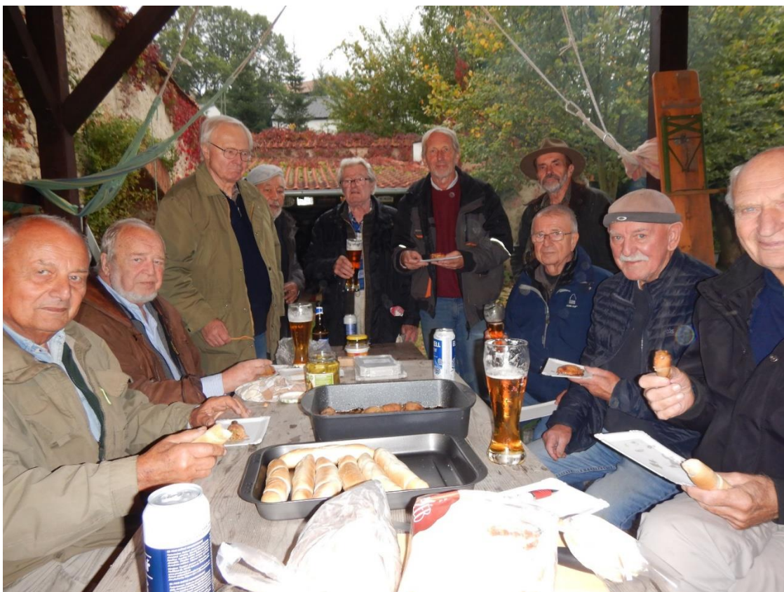
Zleva: Pegas, Zub, Přemík, Mahu, Selim, Job, Reyp, Smeták, Foki a Pacík. Chybí Zbyněk s Yškem, kteří dorazili se zpožděním, když už se nefotografovalo